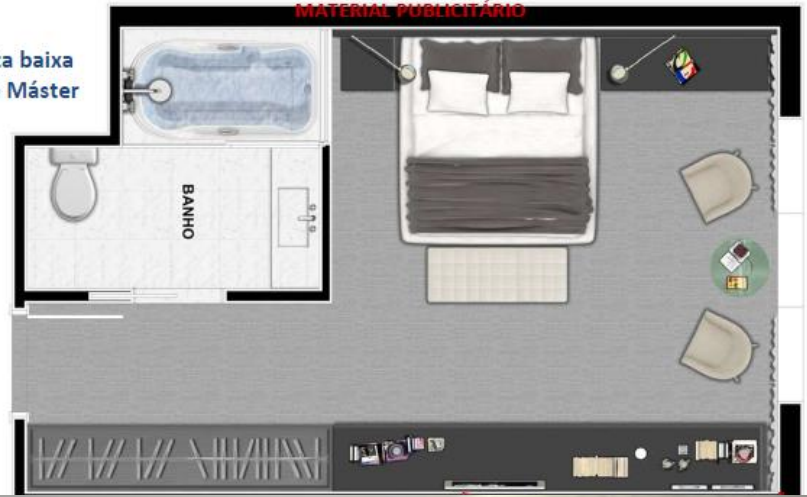
Planta baixa Suíte Máster