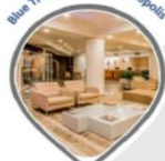
Blue Tree Towers Florianópolis

Blue Tree Towers Hotéis Midscale: Hotéis 4 estrelas focados no segmento executivo.