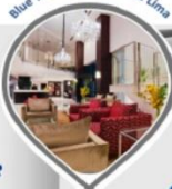
Blue Tree Premium Faria Lima

Blue Tree Premium Hotéis Upscale: Hotéis 4 estrelas com serviços de 5 estrelas, localizados nas principais cidades do país.