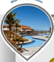
Blue Tree Park Búzios

Blue Tree Park Hotéis de Luxo: Hotéis 5 estrelas com grandes áreas de lazer e/ou eventos.